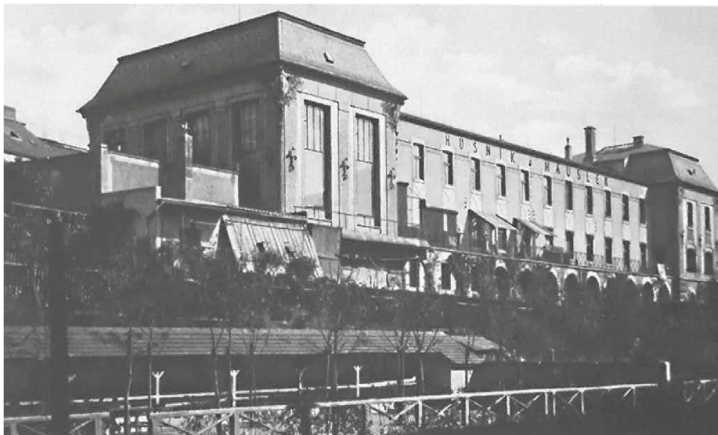
Husník & Häusler - Fotochemigrafický umělecký ústav

Seznámení s Prahou 3 nejen jako se čtvrtí historických tiskáren (Husník & Häusler); návštěva současného tiskařského provozu a nahlédnutí na možnosti digitálních technologií, stejně jako ručního sítotisku; vlastní experimentální tisk z vodní plochy a jeho využití posílené o sociální rozměr písemné komunikace s blízkým člověkem.