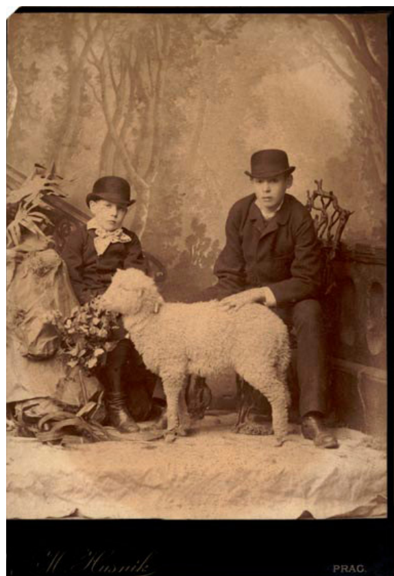
Ateliér J. Husníka: portrét s ovečkou (fotografie), kolem 1882