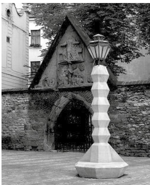
Kubistická ..... Jungmannovo náměstí v Praze, 1912 – 1913