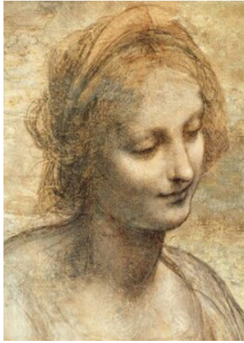
Leonardo da Vinci, studie hlavy, cca 1497