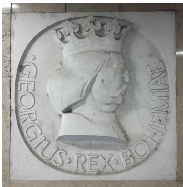
Reliéfní kamenná busta ....., autor Jiří Dušek, 1978