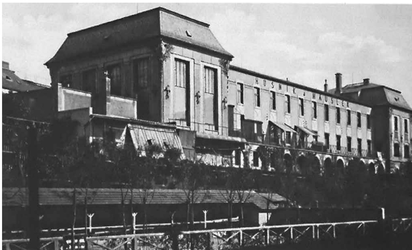
Husník & Häusler - Fotochemigrafický umělecký ústav

Seznámení s Prahou 3 nejen jako se čtvrtí historických tiskáren (Husník & Häusler); návštěva současného tiskařského provozu a nahlédnutí na možnosti digitálních technologií, stejně jako ručního sítotisku; vlastní experimentální tisk z vodní plochy a jeho využití posílené o sociální rozměr písemné komunikace s blízkým člověkem.