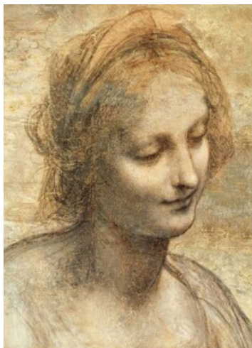
Leonardo da Vinci, studie hlavy, cca 1497