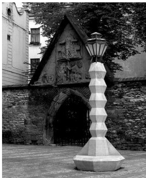
Kubistická ..... Jungmannovo náměstí v Praze, 1912 – 1913