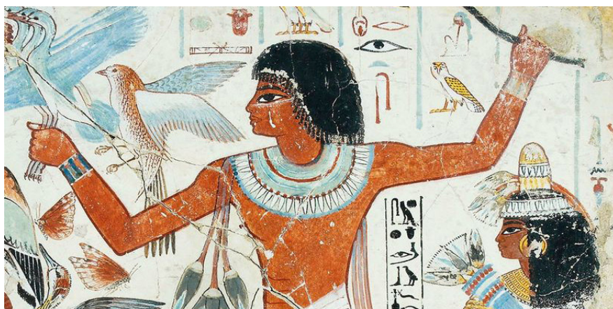
Egyptské umění, detail nástěnné malby, cca 1350 př. n. l.

Tento úkol je možná pro starší děti, ale to rozhodně neznamená, že jej nemůže zkusit každý, kdo má chuť. A nepotřebuješ ani moc odvahy. Zkus poznat, které z obrázků neukazují skutečnost viděnou jen z jednoho místa. Označ tedy ty, které kombinují několik úhlů pohledu.