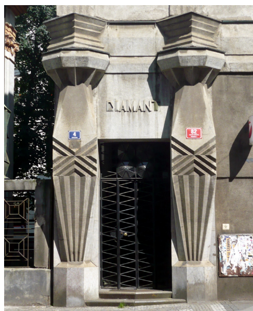
Dům ..... Lazarská ulice 1, Praha, 1912 – 1913, detail