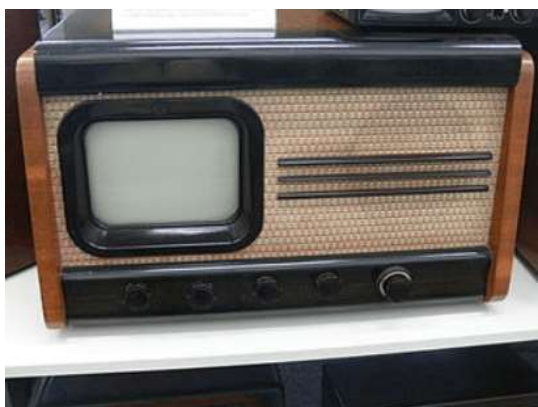
Tesla 4001 A

V Československu zahájeno pravidelné televizní vysílání, 3 dny v týdnu